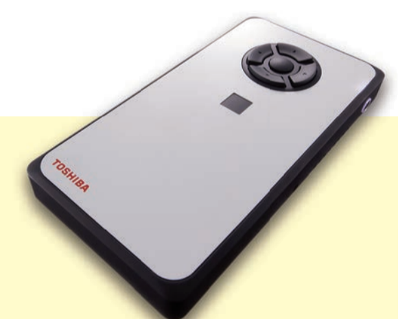
モバイルエッジコンピューティングデバイス DE100

<対応 OS> Windows 10 pro Windows 10 IoT Enterprise